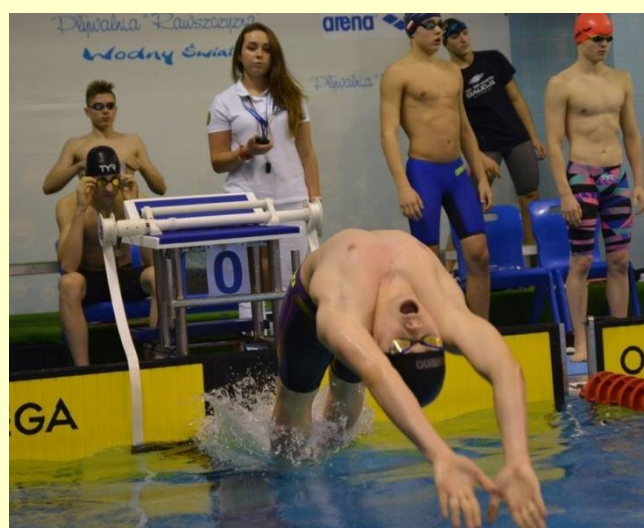
W klasie usportowionej będziesz mieć możliwość rozwijania swoich sportowych pasji, udziału w ciekawych wydarzeniach sportowych.