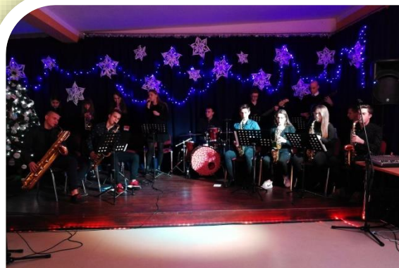
STASZICÓWKA_BAND – od lat uświetnia wydarzenia szkolne, powiatowe, wojewódzkie...