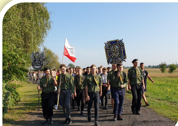
Drużyna Harcerska im. Ludwika Machalskiego „Mnich” dba o wartości duchowe i sprawność fizyczną