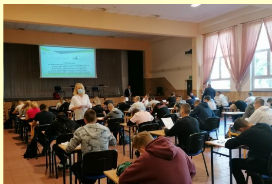
Szkolenie BHP dla budowlanców