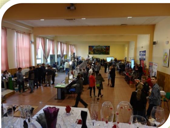
Dni Techniki – coroczna impreza organizowana od 2014 roku