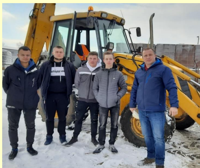
Kurs obsługi koparko – ładowarki w ramach projektu „Kompleksowy rozwój Zespołu Szkół”