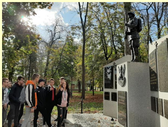
U nas lekcje odbywają się nie tylko w salach szkolnych. Na zdjęciu młodzież podczas plenerowej lekcji historii.

Jeśli interesujesz się sportem i wiążesz z nim swoją przyszłość, bądź chcesz aplikować do różnego rodzaju służb mundurowych, ta klasa jest dla Ciebie. Podczas czterech lat edukacji nabędziesz i poszerzysz swoją wiedzę teoretyczną oraz indywidualne umiejętności sportowe. W trakcie nauki będziesz mieć możliwość zdobycia wielu uprawnień m.in.: karty pływackiej, ratownika WOPR, kursu wspinaczkowy, kursów sędziowskich, kursu kwalifikowanej pomocy przedmedycznej, kwalifikacje strzeleckie. Ponadto każdy uczeń tej klasy będzie miał możliwość uczestniczenia w obozach letnich i zimowych, rajdach pieszych czy wycieczkach rowerowych. Zwiększona liczba godzin wychowania fizycznego zagwarantuje dobre przygotowanie sprawnościowe wszystkim tym, którzy będą aplikować do straży pożarnej, wojska, policji czy innych służb, a także na uczelnie sportowe.