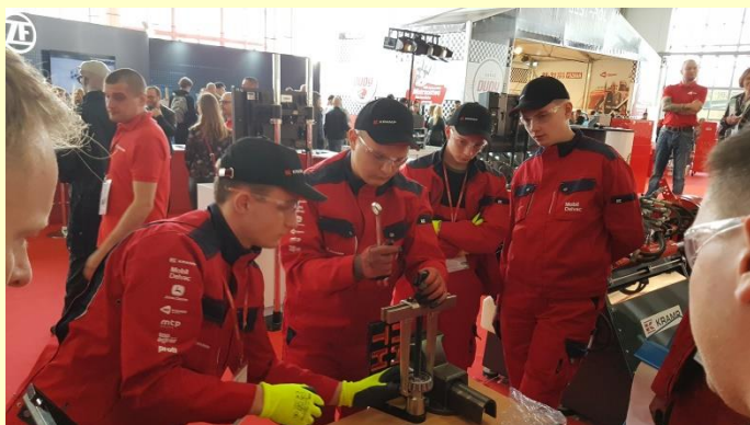
Mistrzostwa mechaników w Poznaniu