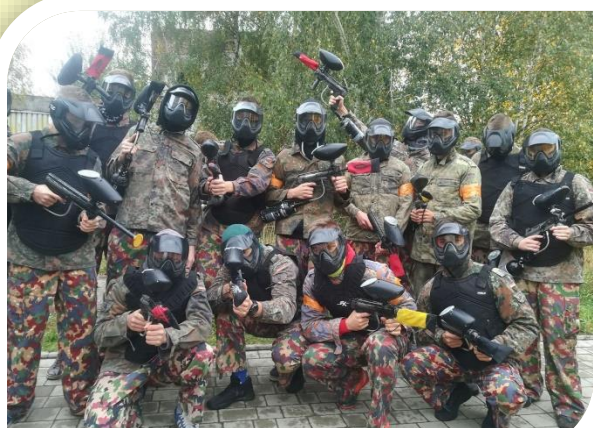
Wyjazdy, wycieczki, rajdy górskie, rajdy rowerowe – tak integrujemy się po lekcjach