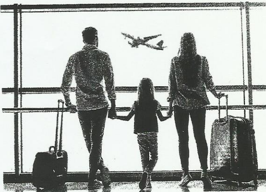
1. Мы сейчáс в _____.