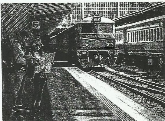
3. Óля и Кóля на _____.